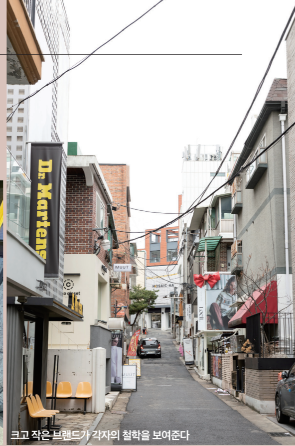
크고 작은 브랜드가 각자의 철학을 보여준다