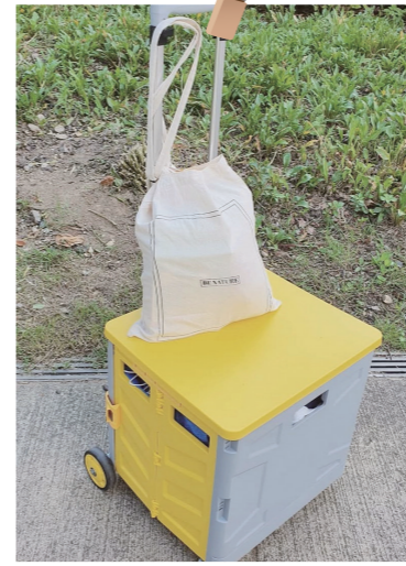
경의선숲길의 기차를 닮은 노란 카트와 에코백에 용문시장의 봄을 담고, 꿈세권에서 제로웨이스트를 실천해요 정*주(신계동)