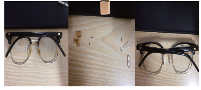
변색된 안경 코받침 부분을 버리지 않고 드라이버 하나로 셀프 교체! 고쳐 쓰는 습관이 쓰레기를 줄여요. 이*희(한강로동)