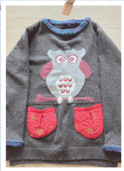
즐거 입는 옷을 리폼했어요. 털실로 마무리하고 주머니도 달아 주니 새로운 옷이 되었어요. 김*애(효창동)