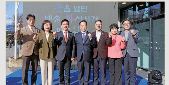
용산문화재단 출범식 참석