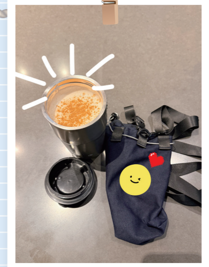
따뜻한 카푸치노를 텀블러 가방에 담아 카페를 나서며 뭔가 뿌듯하다. “지구야 나 오늘도 잘 했지?” 박*영(후암동)