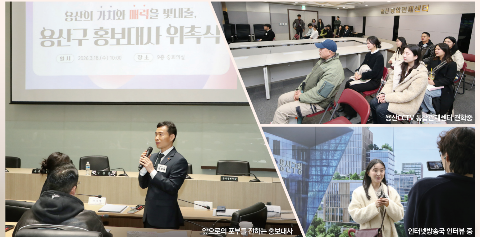
앞으로의 포부를 전하는 홍보대사

하게 됩니다. 국립중앙박물관과 리움미술관이 전하는 깊은 문화의 향기. 고즈넉한 옛 골목 너머로 펼쳐지는 해방촌과 용리단길의 톡톡 튀는 생기발랄함. 용산은 과거와 현대가 아름답게 교차하는 다채로운 매력을 품은 도시입니다. 이 특별한 용산의 이야기를 전하기 위