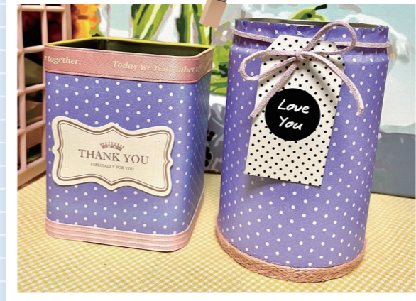
영양제 박스나 통들 버리지 않고 리폼해서 다용도 소품함으로 쓰고 있어요. 임*연(이태원동)