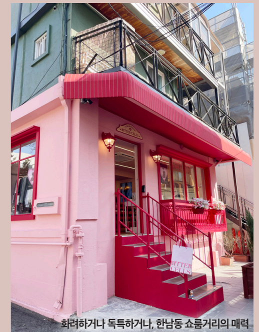
화려하거나 독특하거나, 한남동 쇼룸거리의 매력