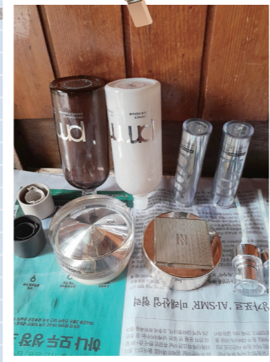
쓰레기 분리배출은 의무입니다. 다소 번거롭지만 화장품 공병을 세척 후 반납해 포인트로 받습니다. 윤*경(청파동)