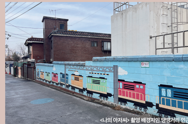
<나의 아저씨> 촬영 배경지인 팽팽거리 인근