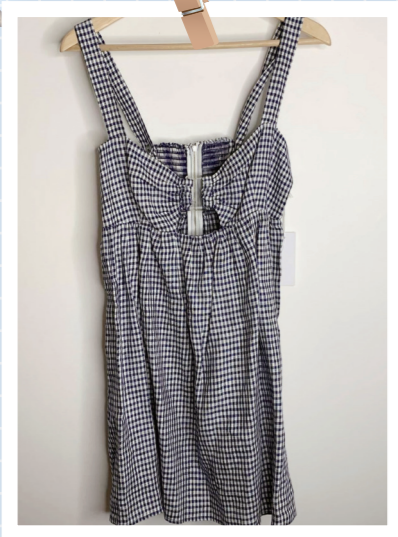
리폼은 익숙한 옷감에 새로운 감각을 더해 새로운 느낌을 주는 작업이 아닐까요. 김*경(한남동)