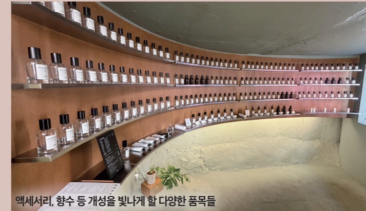
액세서리, 향수 등 개성을 빛나게 할 다양한 품목들