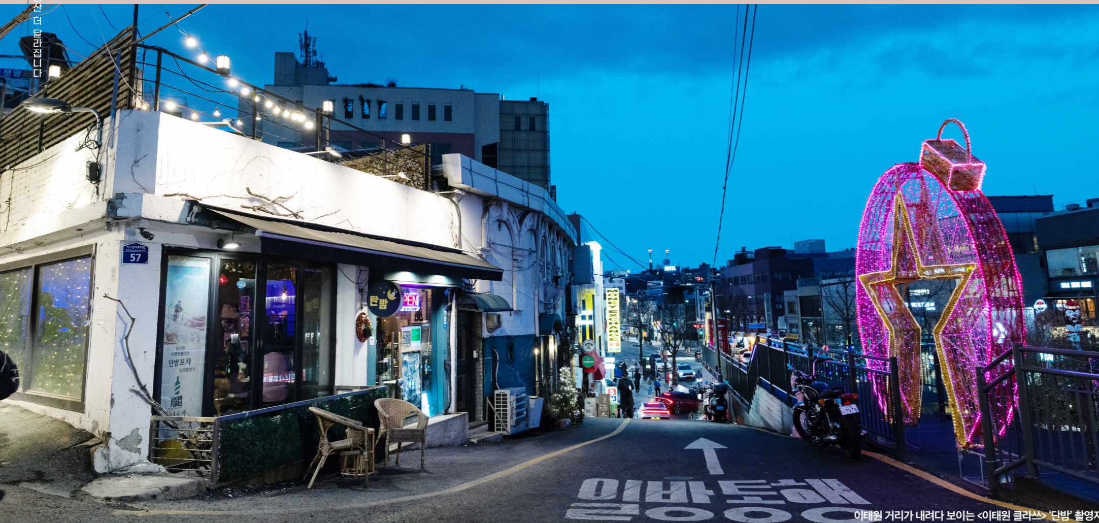
이태원 거리가 내려다 보이는 <이태원 클래스> '단밤' 촬영지