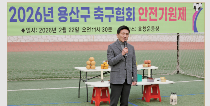
2026년 용산구 축구협회 안전지원팀 구의회 의장 축하