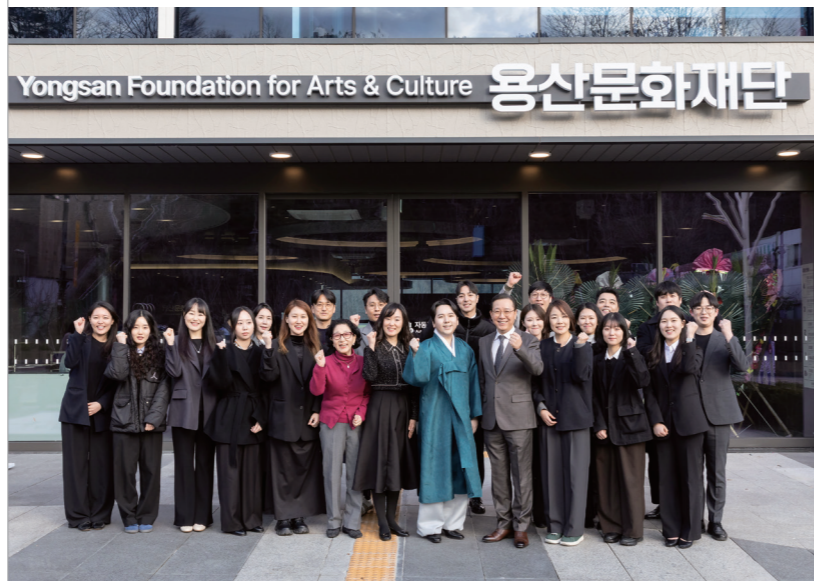
용산문화재단 직원들과 함께

는 지속 가능한 시스템을 구축하겠다는 목표를 강조했다. “초대 이사장과 대표이사로서 가장 중요한 역할은 재단의 기초를 다지고 시스템을 구축하는 것입니다. 다음 세대가 이어갈 수 있는 지속 가능한 사업을 만들겠습니다. 용산 구민 여러분이 K-컬처 중심 도시로 도약하는 용산의 모습을 함께 지켜보고 응원해 주시길 바랍니다.”