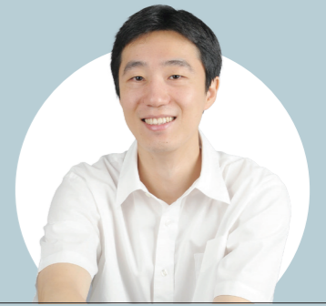
글. 고호관 작가

1969년 7월 20일, 미국의 아폴로 11호는 역사상 최초로 달 표면에 내려앉는데 성공했다. 그 뒤로 아폴로 17호에 이르기까지 달에는 몇 차례 더 다녀왔다. 이후 달 외의 다른 천체에 가보지는 못했으므로 달은 인간이 처음이자 유일하게 가본 적이 있는 지구 밖 천체다.