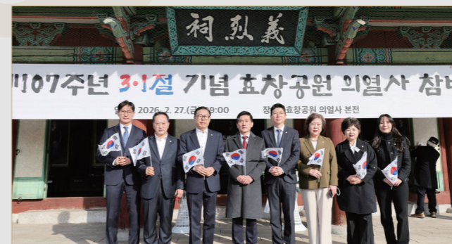
제107주년 3·1절 기념 효창공원 의열사 참배