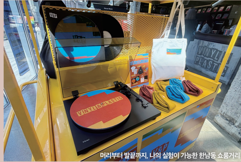
머리부터 발끝까지, 나의 실험이 가능한 한남동 쇼룸거리