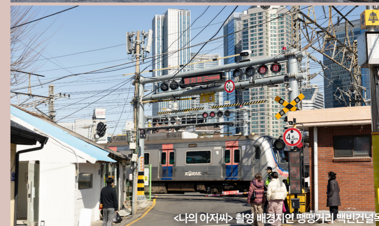
<나의 아저씨> 촬영 배경지인 팽팽거리 백민건널목