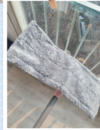
봄맞이 청소는 물티슈 대신 물걸레로 해보려고요. 마음이 한결 편해졌습니다. 최*리(효창동)