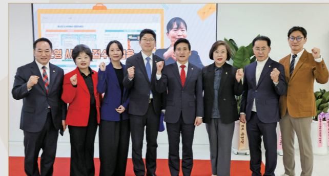
용산 50플러스센터 개관식 참석