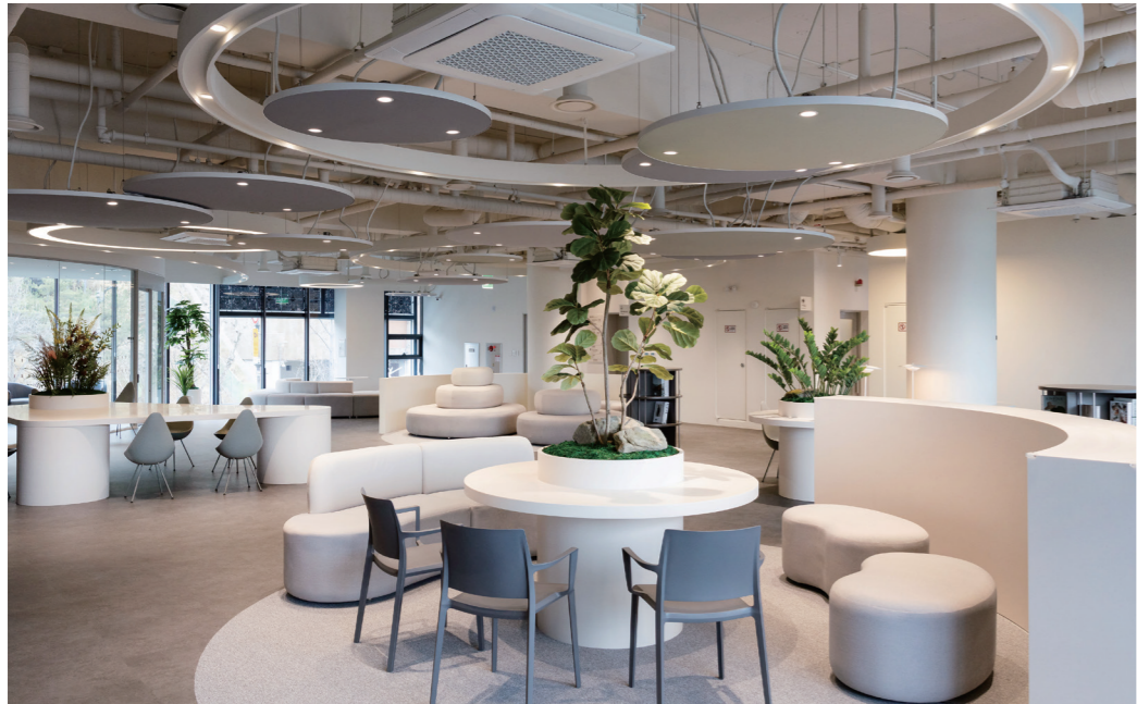
용산문화재단 2층 전경

“용산에 산다는 것이 문화적으로 자부심이 된다는 느낌을 만들고 싶습니다”