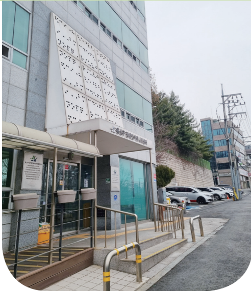
창회정터 표지석이 있는 용산구장애인커뮤니티센터