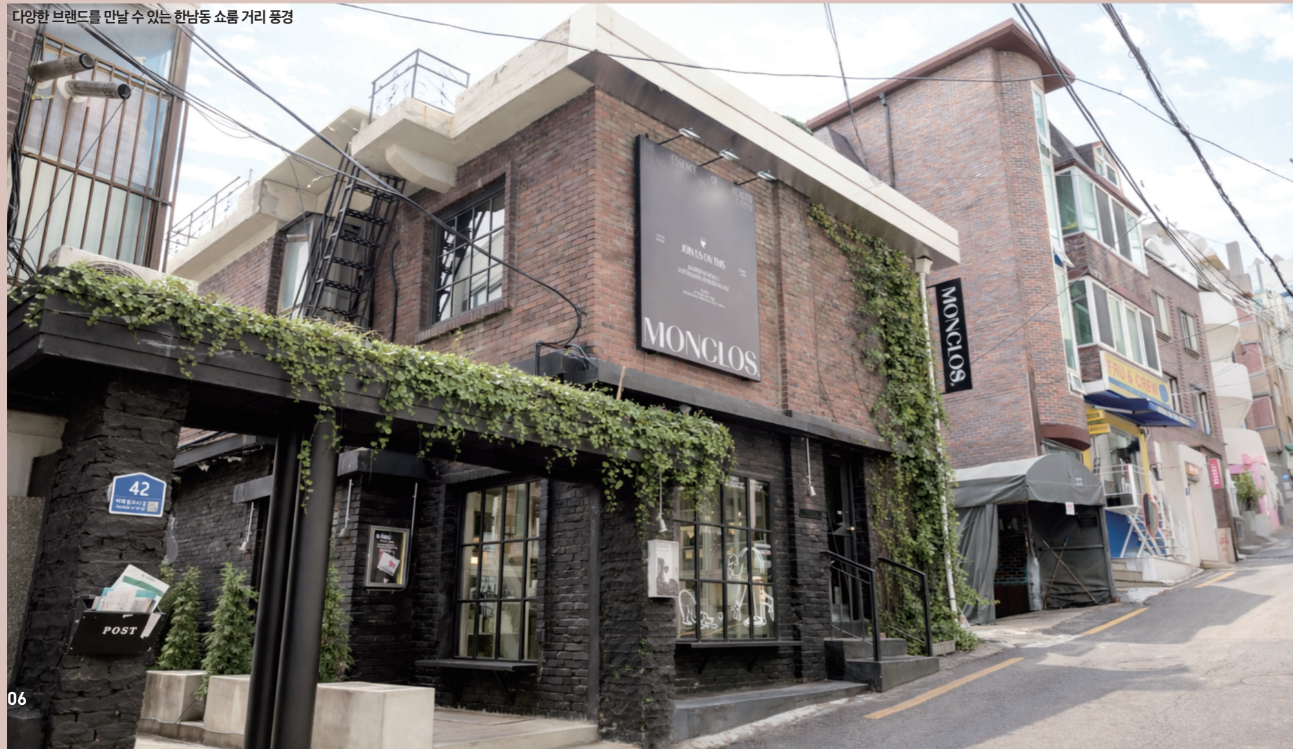
다양한 브랜드를 만날 수 있는 한남동 쇼룸 거리 풍경