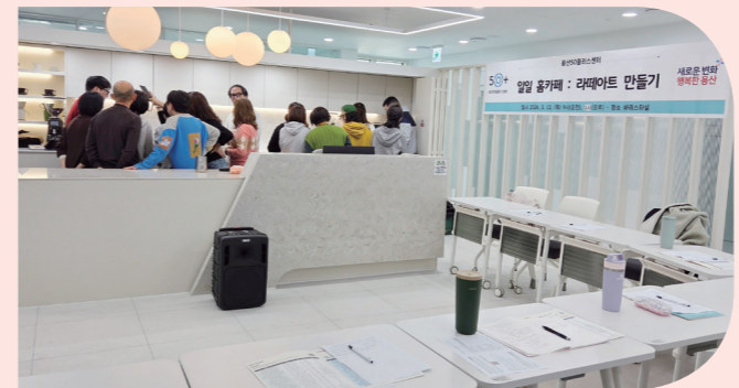
'라떼아트'에 열중한 수강생들

지난 3월 12일, 센터의 본격적인 첫 수업이 시작되는 날 직접 현장을 방문해 보았다. 깔끔하고 환한 강의실을 비롯해 중정 느낌의